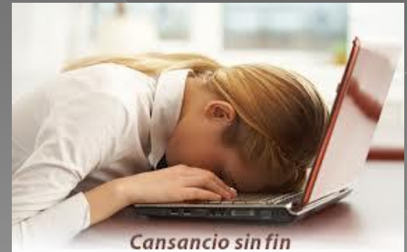
Cansancio sin fin